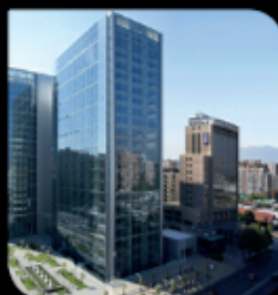
Oficinas Fundadores Badajoz / Apoquindo