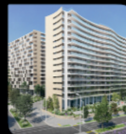
Departamentos Club de Campo Las Condes / San Damián

Av. La Dehesa 440 / Fono: +56 2 2206 0809 / Cel: +56 9 9533 8952 / corneroffices@nahmias.cl / www.nahmias.cl