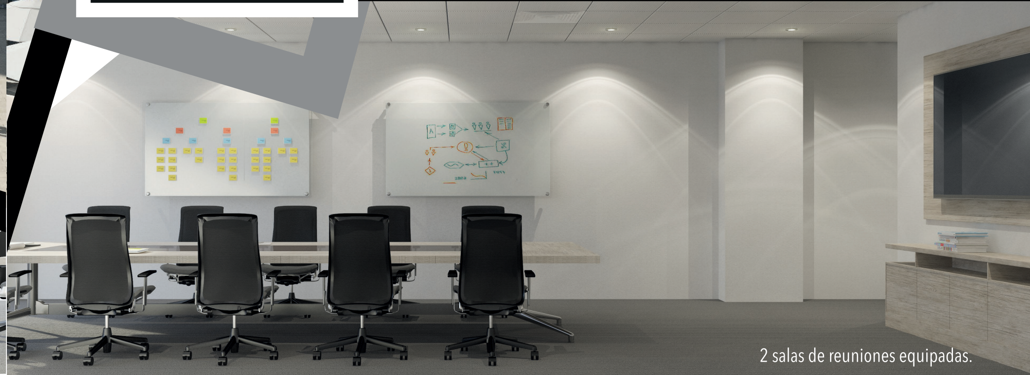
2 salas de reuniones equipadas.

La arquitectura y equipamiento de Corner Offices son la cara de tu negocio. Desarrollado por expertos, bajo los más altos estándares de calidad, el edificio responde a todas tus necesidades con una imagen superior.