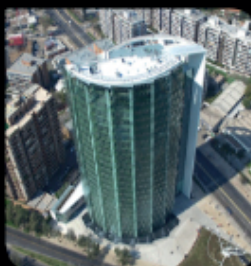
Oficinas CChC Apoquindo / Las Condes