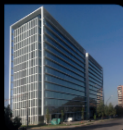
Oficinas Puertas de La Dehesa La Dehesa / Escrivá de Balaguer