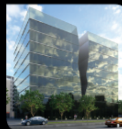
Oficinas On-Offices Las Condes / Las Tranqueras